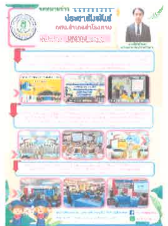
กคน.อำเภอสำโรงทาบ