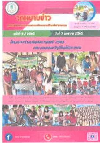
กศน.อำเภอสนม