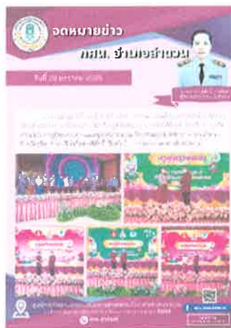
กคน.อำเภอลำตวน