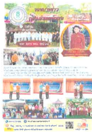
กคน.อำเภอบัวเขต