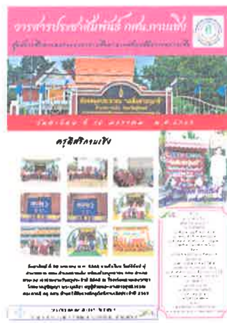
กคน.อำเภอกาบเชิง