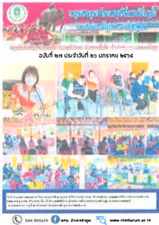
กศน.อำเภอท่าตูม