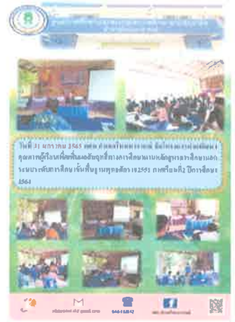
กศน.อำเภอโนนนารายณ์