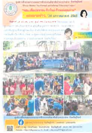
กคน.อำเภอปราสาท