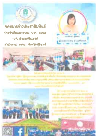
กคน.อำเภอศรีณรงค์