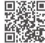
ลิงก์จดหมายข่าว สำนักงาน กศน.จังหวัดสุรินทร์

แหล่งข้อมูล : เว็บไซต์สำนักงาน กศน.จังหวัดสุรินทร์ ( http://surin.nfe.go.th/ )