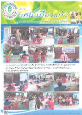
กศน.อำเภอรัตนบุรี