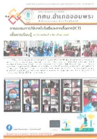
กคน.อำเภอจอมพระ