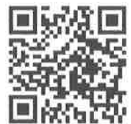
รายงานการประชุม

รายงานการประชุมผู้บริหาร/หัวหน้ากลุ่มงาน/หัวหน้างาน สำนักงาน กศน. จังหวัดสุรินทร์ ประจำปีเดือน มกราคม ๒๕๖๕ จำนวน ๒๐ หน้า ประชุมเมื่อวันที่ ๖ เดือน มกราคม พ.ศ. ๒๕๖๕ ณ ห้องประชุมประทายสมันต์ สำนักงาน กศน. จังหวัดสุรินทร์