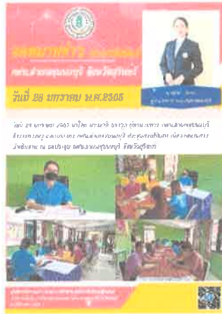
กศน.อำเภอชุมพลบุรี