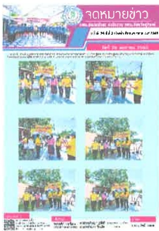
กคน.อำเภอสังขะ