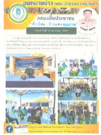
กคน.อำเภอเขวาสินรินทร์