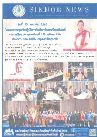
กคน.อำเภอศีขรภูมิ