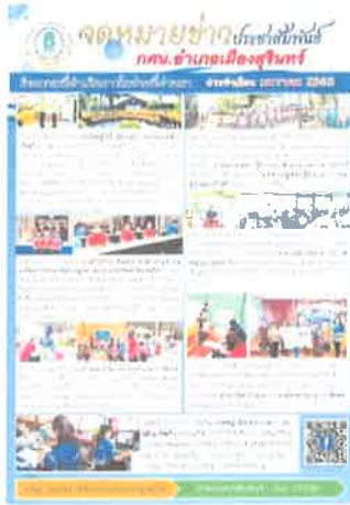
กคน.อำเภอเมืองสุรินทร์